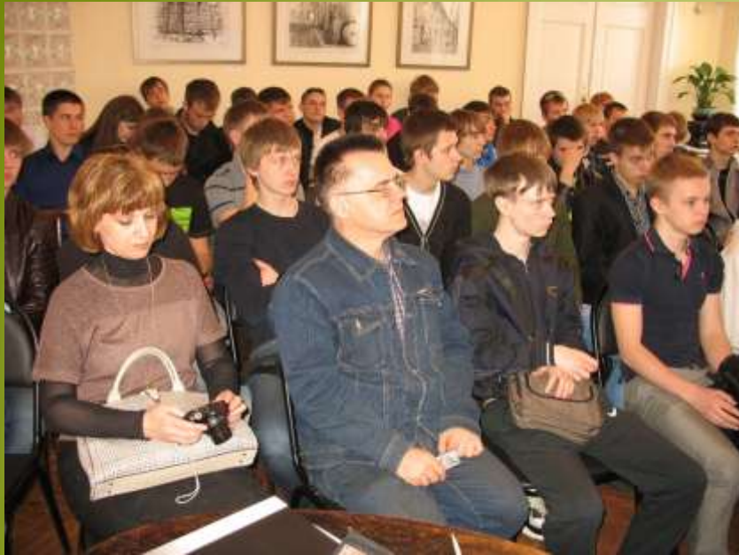
Студенты Нижегородского автомеханического техникума