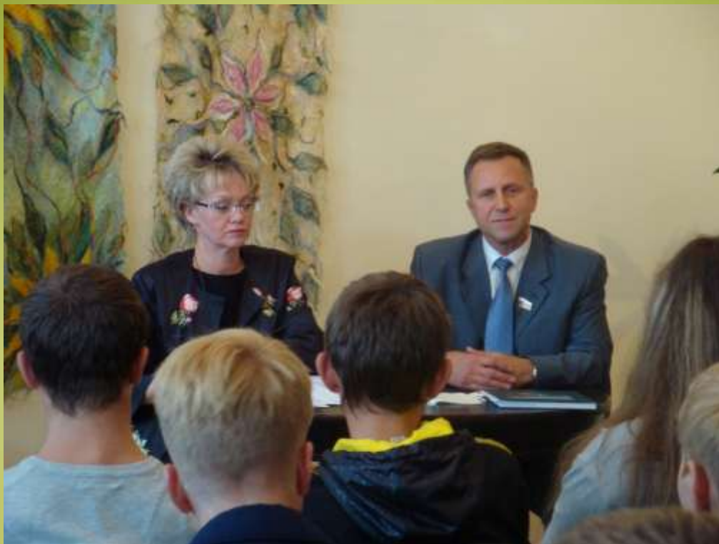
Депутат Законодательного собрания НО Андрей Тарасов