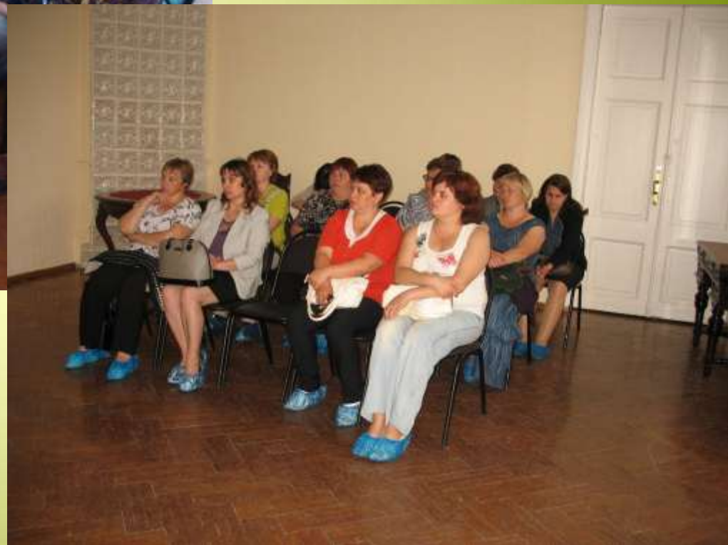
Библиотекари Воротынского района на занятиях для специалистов в музее