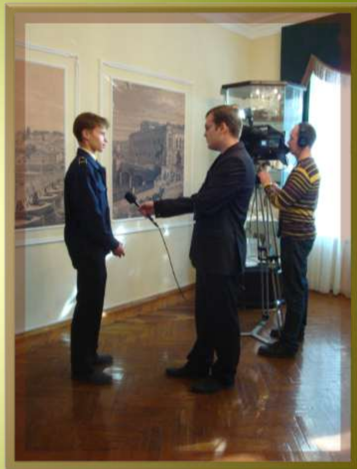
Интервью у ученика кадетской школы в музее после мероприятия про проекту