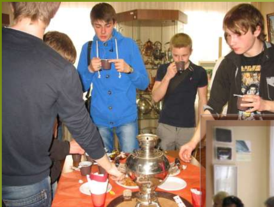
Русское чаепитие для учеников кадетской школы