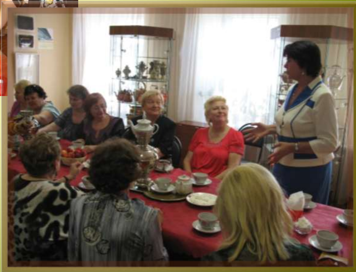
Чаепитие для педагогов педагогического колледжа