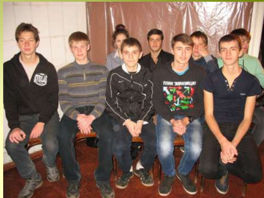
Ученики кадетской школы №4