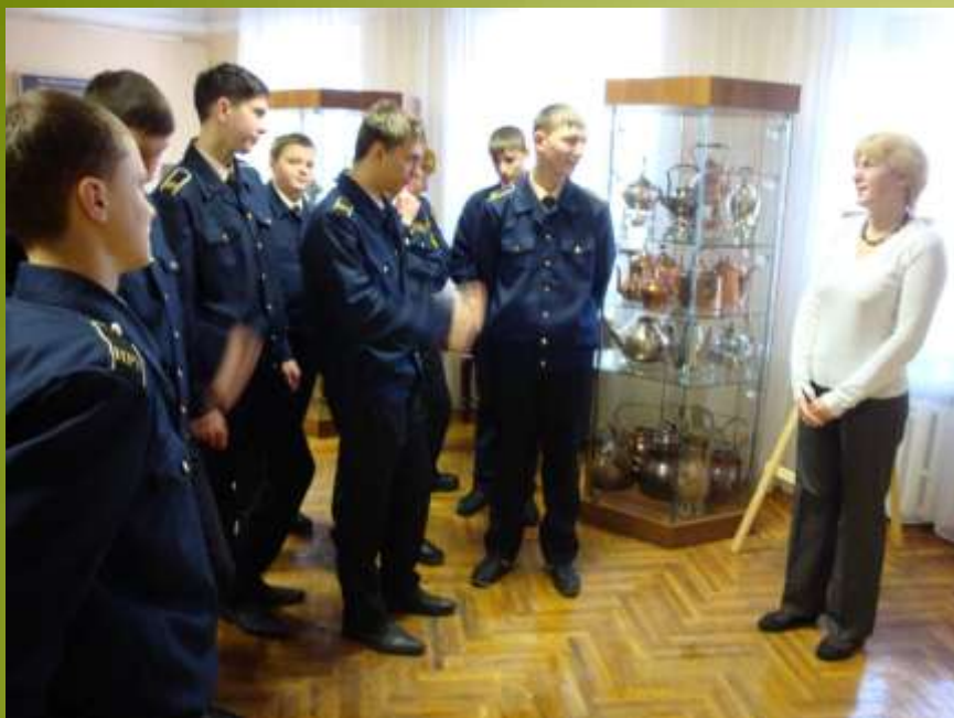
Студенты Нижегородского Речного училища