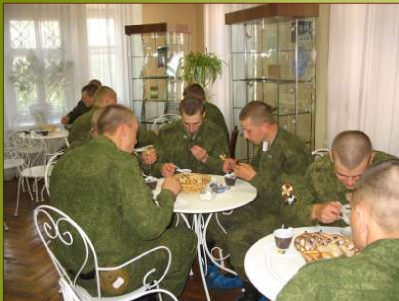
Военнослужащие в/ч 7408 в созданной в музее зоне гостеприимства