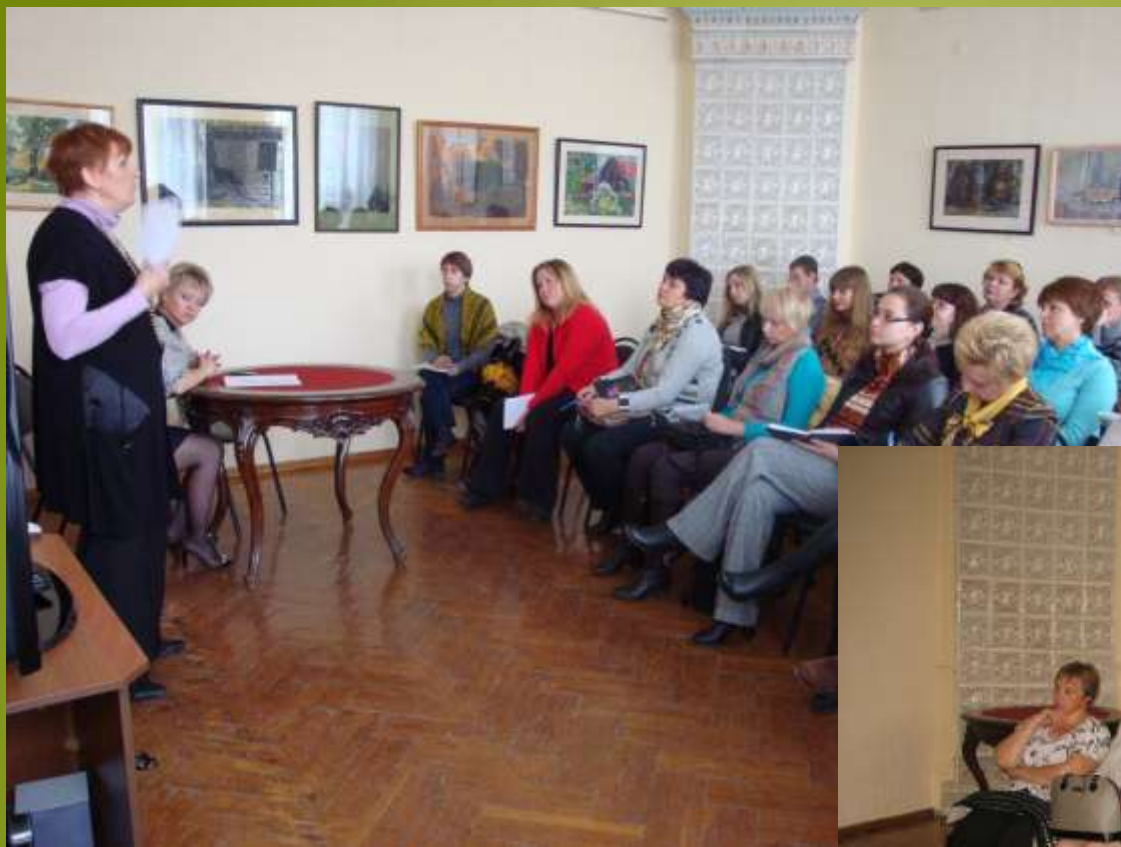
Работники музеев районов Нижегородской области на занятиях для специалистов в музее