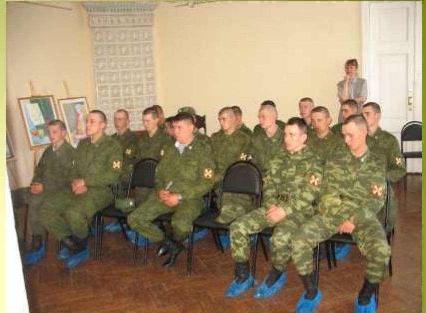
Войсковая часть № 7408