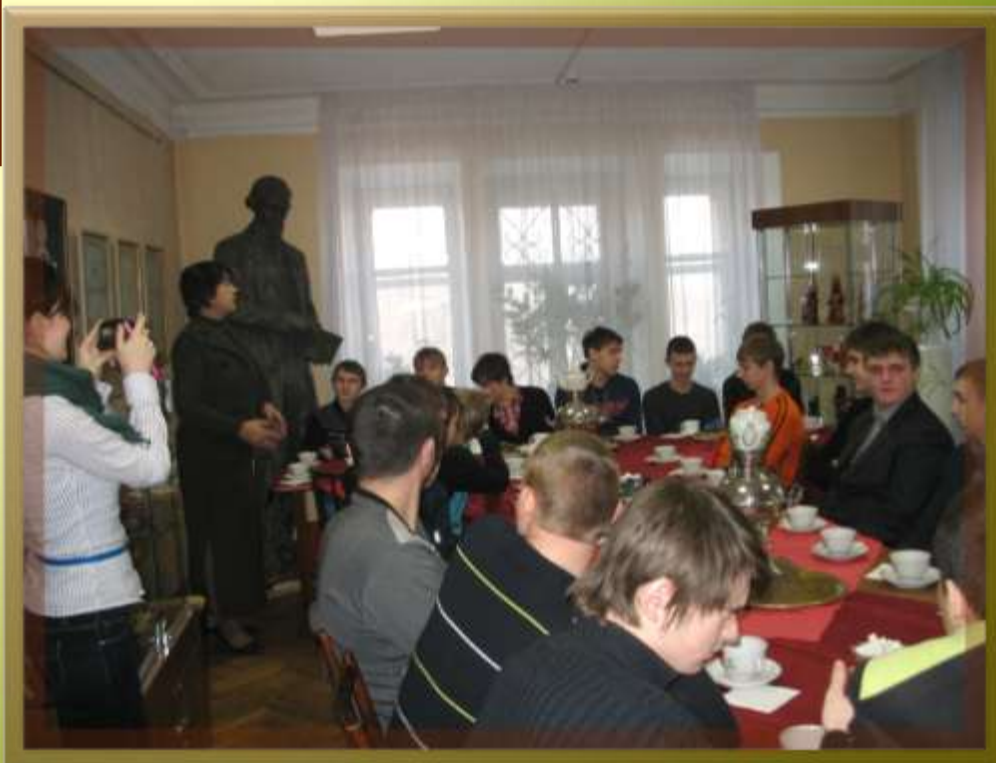
Церемония «Русское чаепитие» для студентов НАМТ