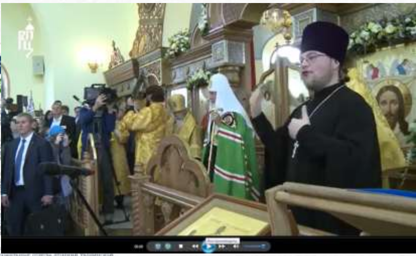
Синодальный отдел совместно с ВОГ выпустит видеословарь православной лексики для глухих с использованием искусственного интеллекта