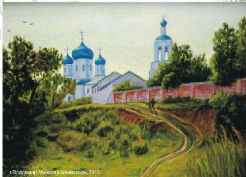
г.Владимир Мужской монастырь, 2013