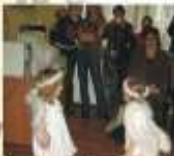
Открытие выставки. Представление ангелов