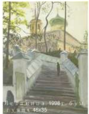
Ледяная 1998 г. бум. гуашь 45x35