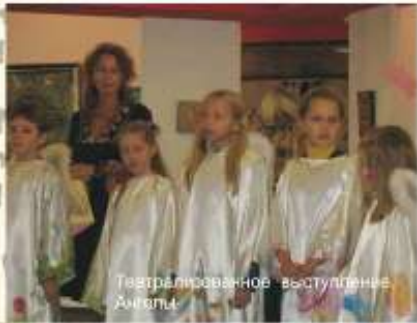
Театрализованное выступление Ангелы