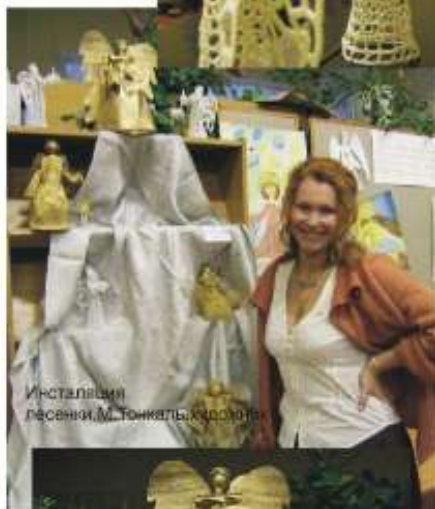
Инсталляция песенки М.Тонкаль, художница