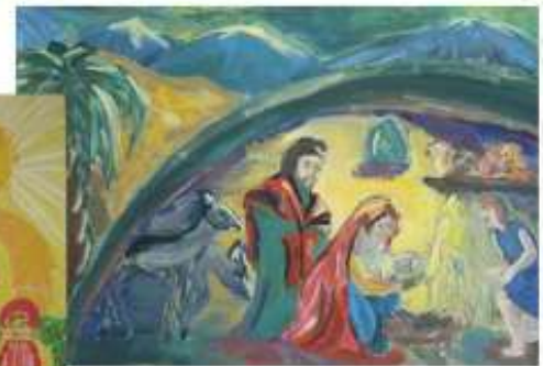
Александрова Софья.13 лет.Рождество.2012.холст.акрил