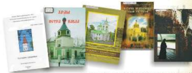
Книги, в которых отражена деятельность красноярских художников и тема православия