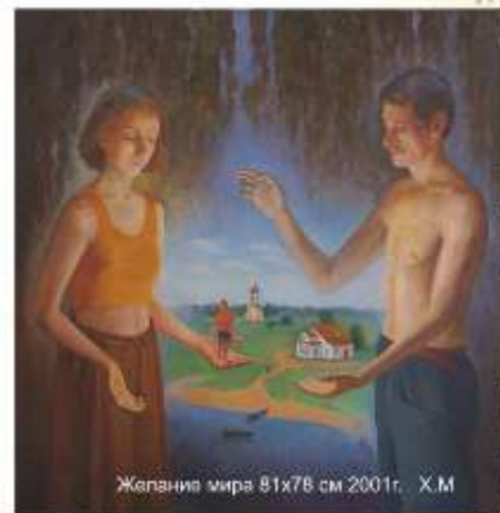
Желания мира 81x78 см 2001г. Х.М