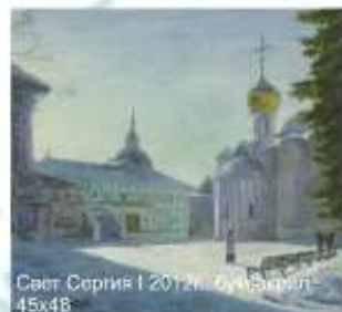
Свет Сергия I 2012 г. 45x48