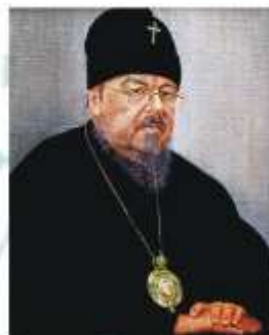
Митрополит Красноярский и Ачинский Пантелеймон. 2012