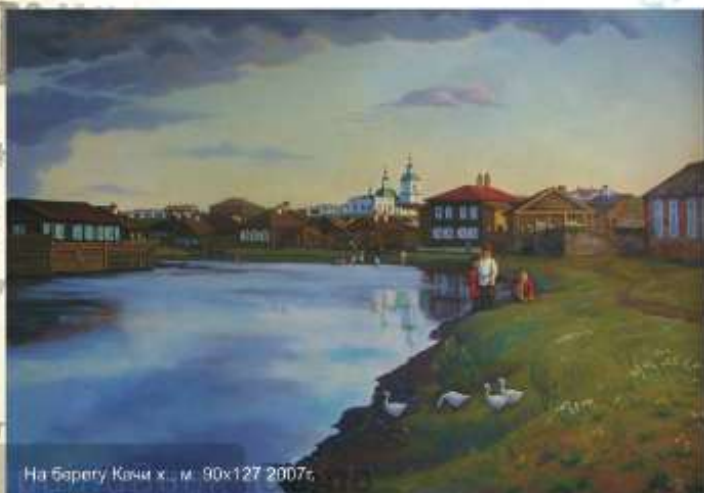
На берегу Качи х., м. 90x127 2007г.