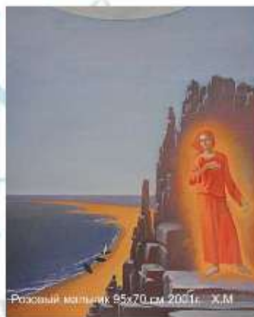
Розовый мальчик 95x70 см 2001г. Х.М