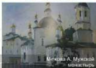
Межова А. Мужской монастырь

1964-1970 гг. Московская средняя художественная школа при институте им. В.И. Сурикова. 1970-1976 гг. Московский Государственный художественный институт им. В.И. Сурикова. 1976-1981 гг. Работа в Красноярском художественном училище им. В.И. Сурикова. С 1979 г. член Союза художников России. С 1981 г. Преподаватель Красноярского Государственного Художественного института. 1982-1984 гг. Ассистентура – стажировка в Московском Государственном художественном институте им. В.И. Сурикова.