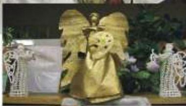
Фрагмент выставки. Ангелы