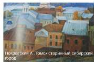
Павловский А. Томск старинный сибирский город