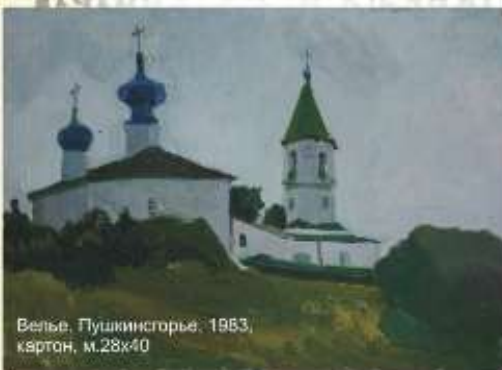
Велье, Пушкинское, 1953, картон, м.28x40