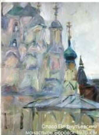
Спасо-Вифаньевский монастырь, Зоревск., 1970 г. И.