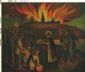
Легенда о княгине Ольге. Х., м. 110x130 2004-2005гг.