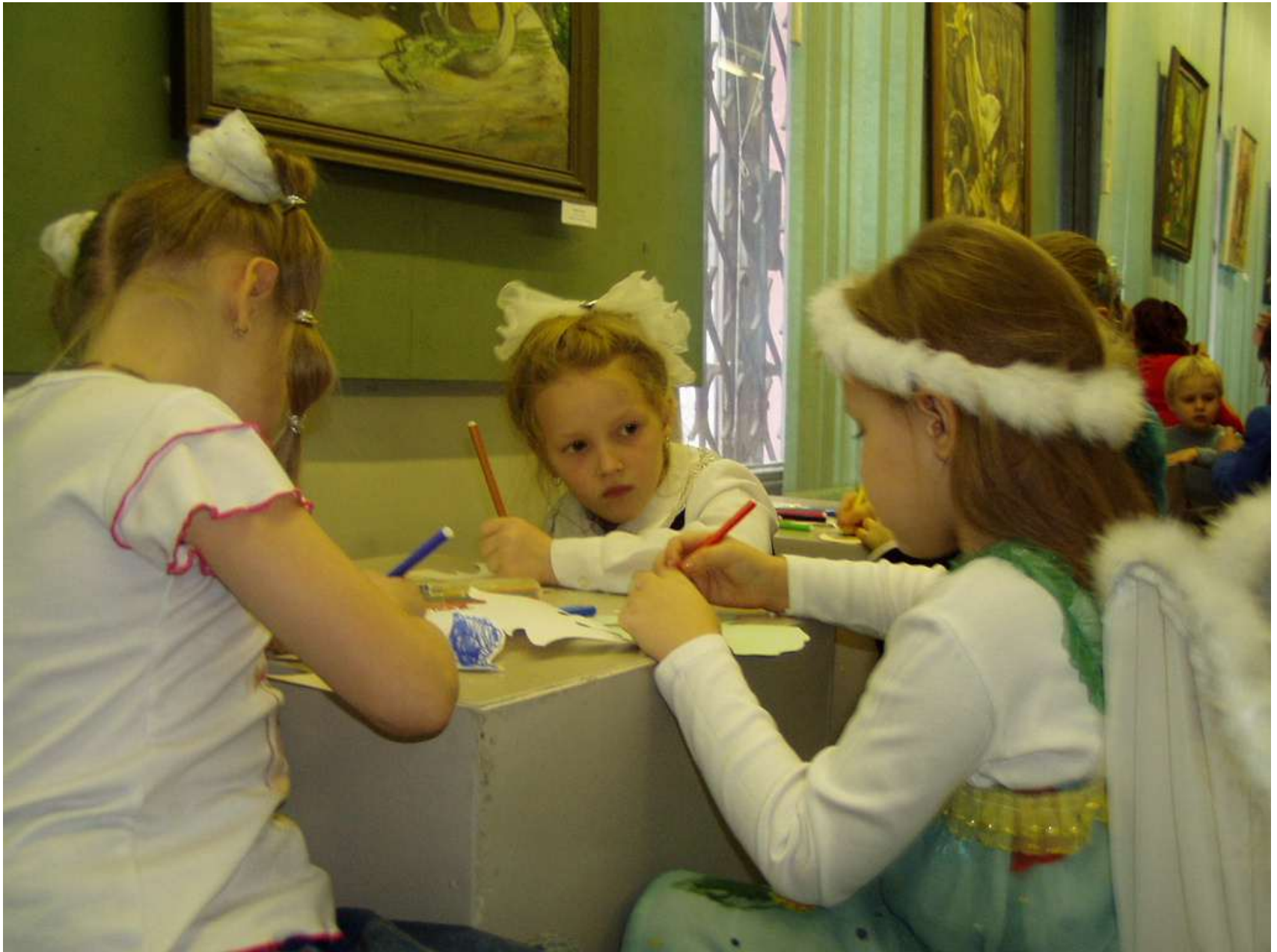
Мастер-класс «Мой ангел»