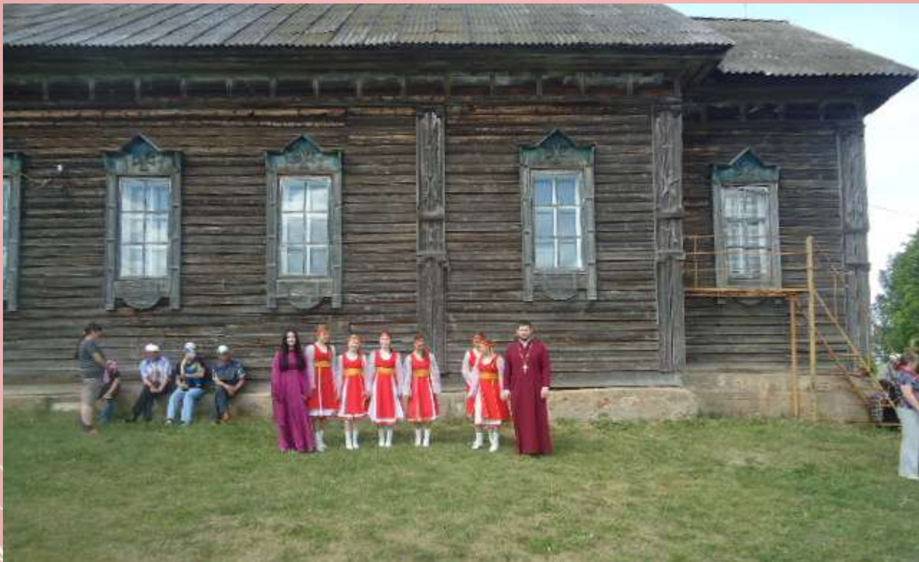
Здание деревянного храма в с. Чумой