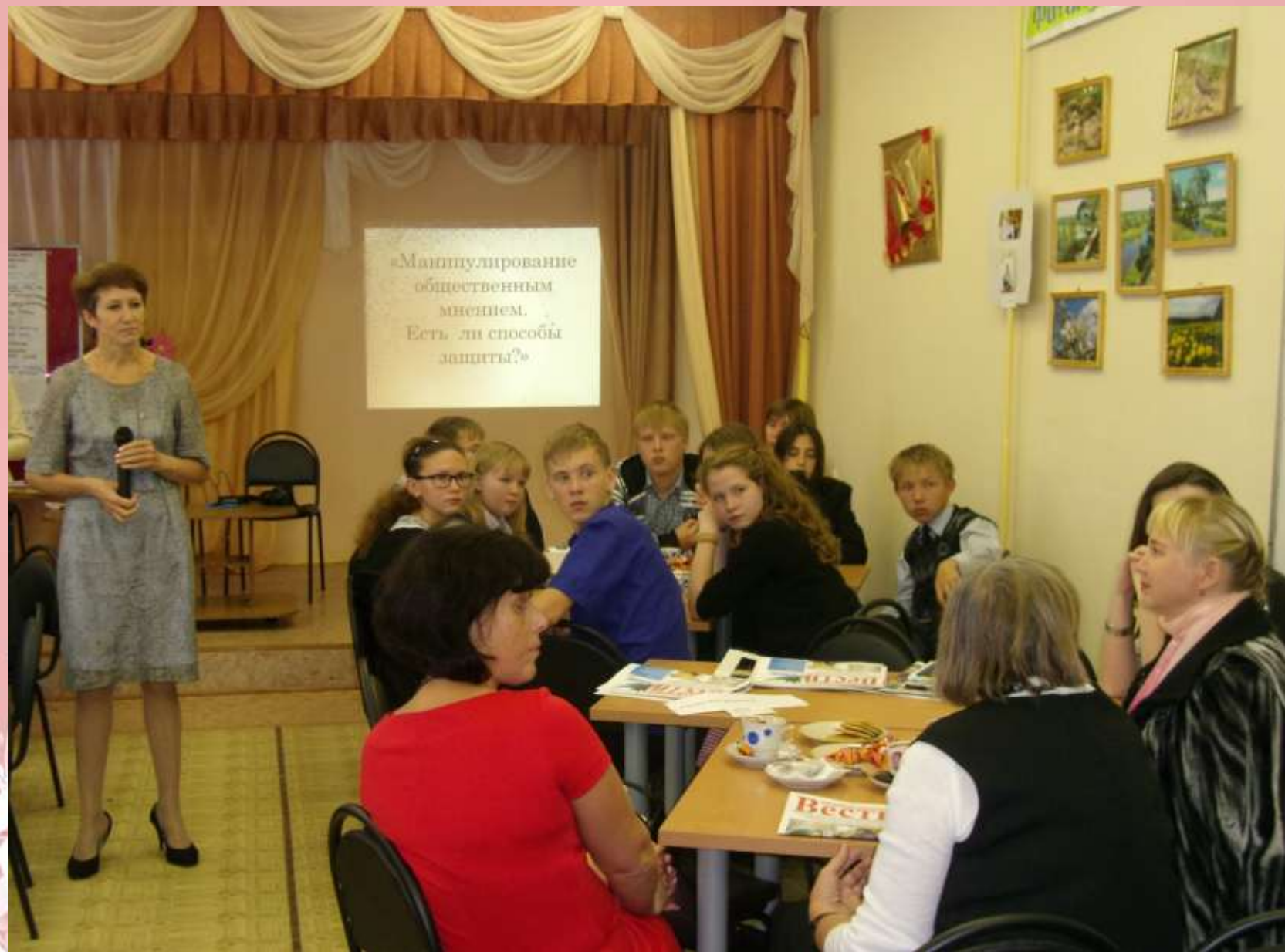
Дискуссионный клуб «Манипулирование общественным мнением. Есть ли способы защиты?»