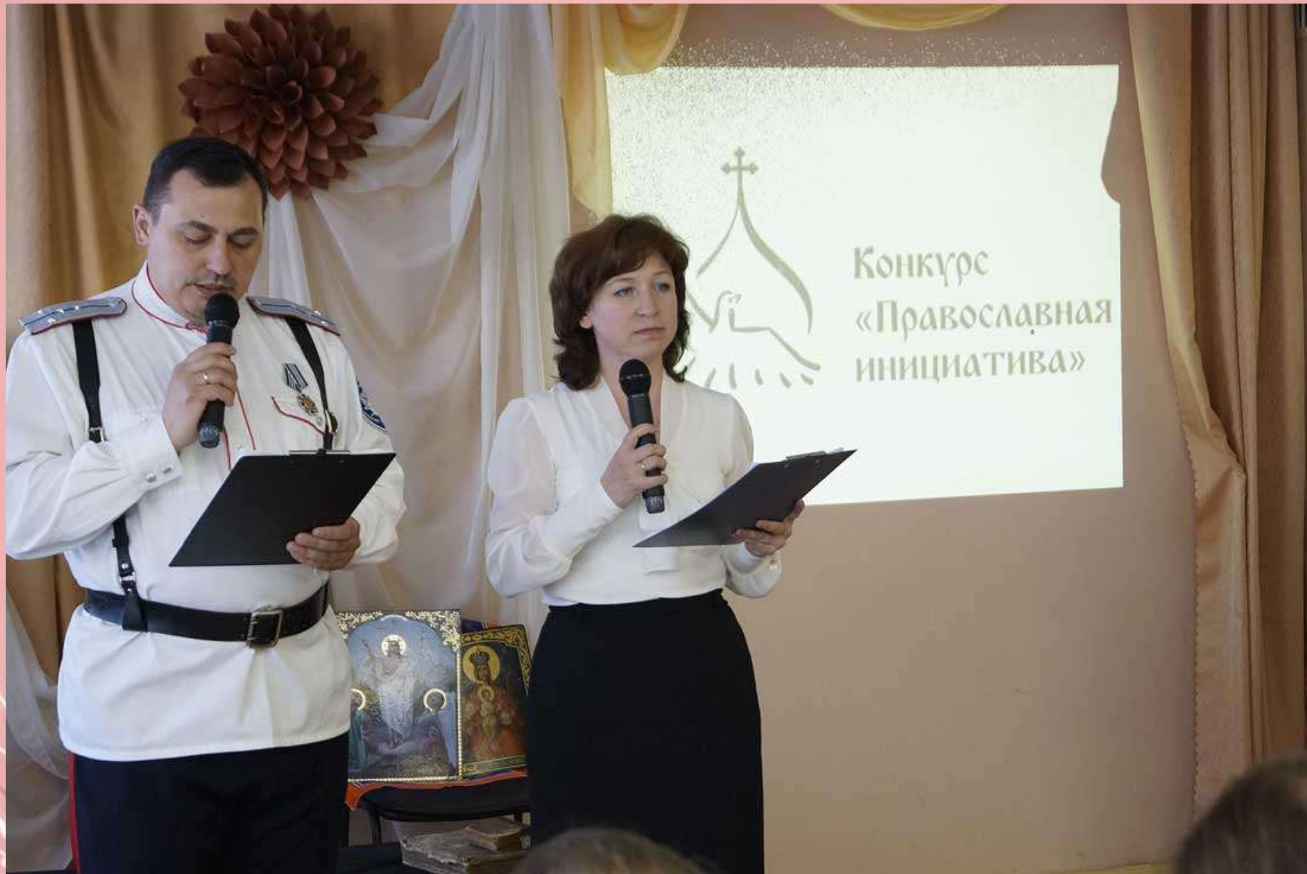
Импровизированный исторический «Земский собор» – общественная презентация проекта