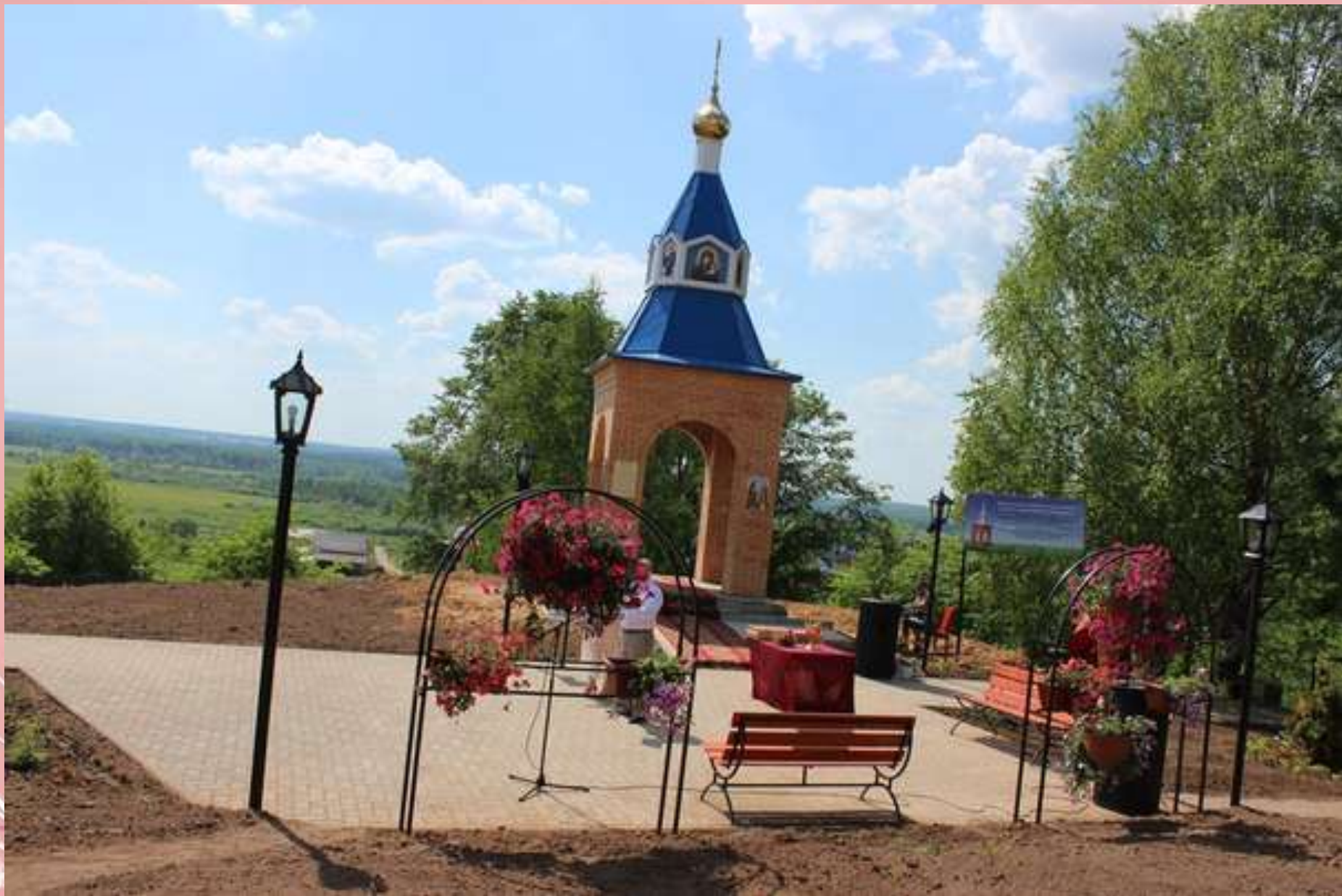
Часовня в честь святых Петра и Февронии Муромских п. Игра.