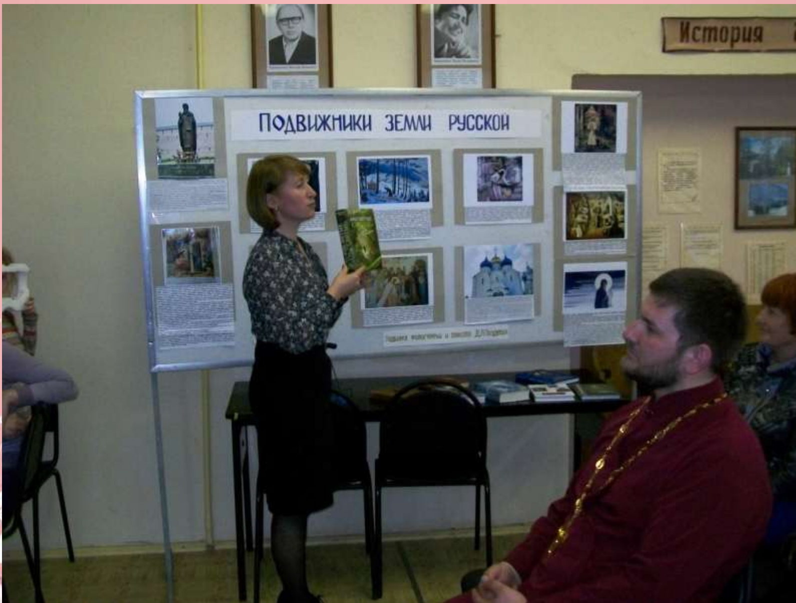
Духовные вечера «Подвижники земли русской. Святые и наши современники»