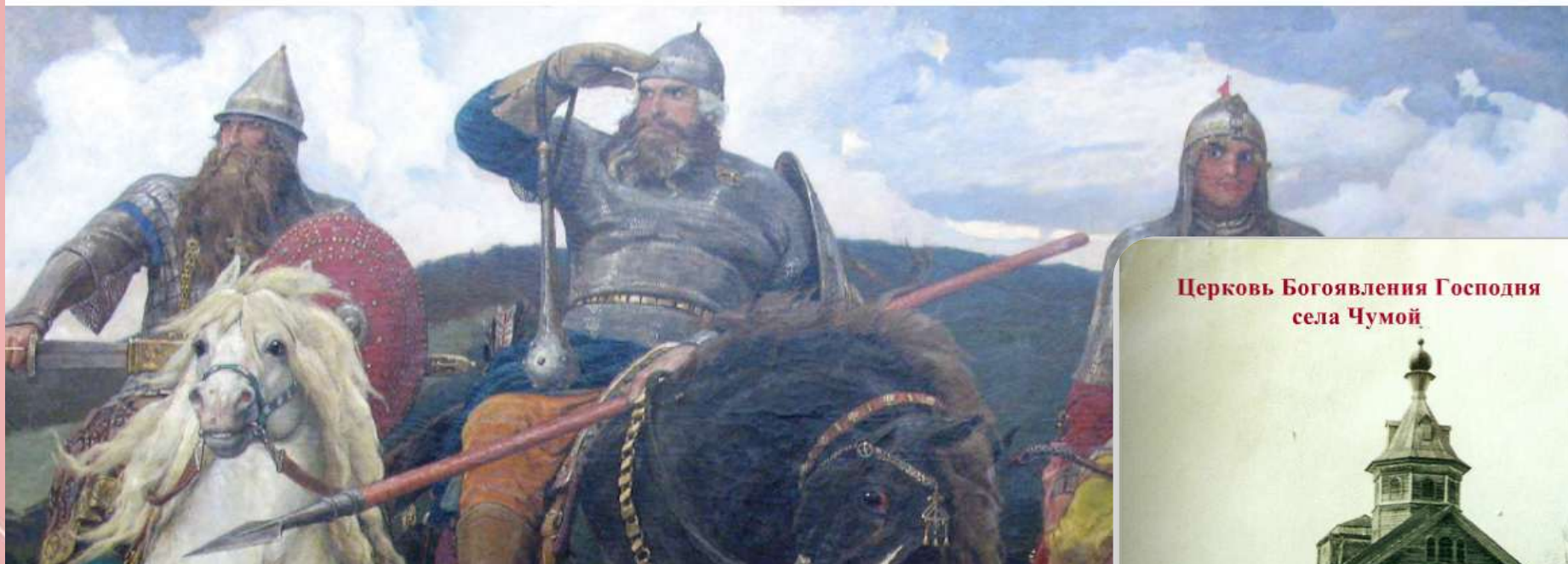
Церковь Богоявления Господня села Чумой