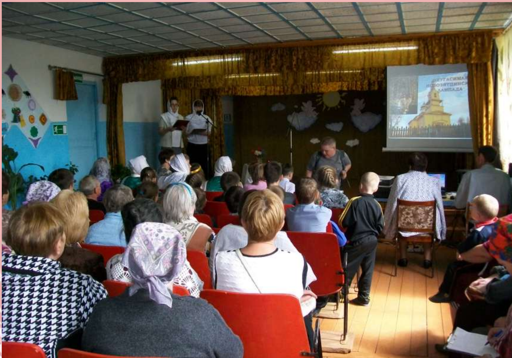
Духовный круг «Неугасимая лампада» в с. Новые Зятцы