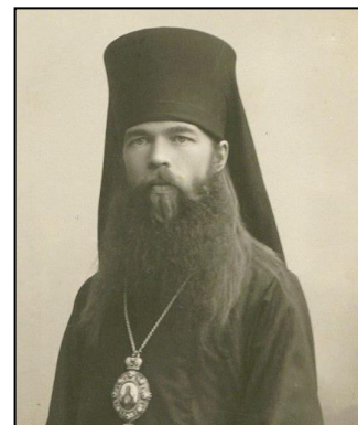
Священномученик Михаил Тихоницкий

В 1917 году, когда Россию захлестнула волна революции и красного террора, скорбя о горе, постигшем русский народ, Патриарх Тихон издал послание, в котором предал проклятию гонителей Церкви, призвал всех людей к миру и согласию.