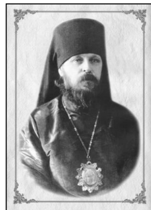
Священномученик Виктор (Островидов)

Священномученик Виктор (Островидов) , епископ Православной Церкви, епископ Глазовский, викарий Вятской епархии (в миру Константин Александрович Островидов) родился 20 мая 1875 в семье псаломщика Троицкой церкви села Золотого Камышинского уезда Саратовской губернии.