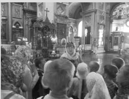
В Арзамасском Воскресенском соборе

и другие). Три встречи прошли за пределами библиотек — состоялись экскурсии на территориях Арзамасского Воскресенского собора, Свято-Николаевского женского монастыря, звонницы храма в честь иконы Божией матери «Живоносный источник». Из отзывов: