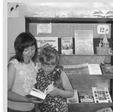
У выставки в библиотеке-филиале № 5