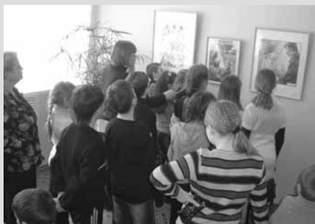
Экскурсия по художественной выставке «Истоки»

Инновационной формой работы библиотеки стала акция «Маршрутка» , в рамках которой на мониторах автобусов № 2 и № 3 демонстрировались видеоэкскурсии . Работа над ними шла несколько месяцев, вовлекая все новых и новых участников из числа читателей. Кто-то снимал видеосюжеты, другие приносили удачно выполненные фотографии, третьи уточняли сведения в архивах. Подготовленные видеоролики стали основой акции «Маршрутка». Круговой автобусный маршрут объединяет старинные и современные улицы, проходит мимо древних храмов и памятников архитектуры. Ежедневно его пассажирами становится пять тысяч арзамасцев и гостей города. Видеоэкскурсии, которые шли на протяжении трех месяцев, помогли обратить их внимание на то, что пронесется за окнами автобуса. Позднее ролики были размещены на YouTube, в блоге «Один-