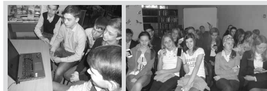
На обучающих занятиях курса «23 дела с мобильным»

рили о православных книгах и духовном краеведении, показывали возможности библиотек. Проходили и групповые, и индивидуальные занятия, в т.ч. через Skype и сеть ВКонтакте. Это позволило корректировать объем материала и темп занятий. Конкурс творческих работ «Духовная нива» продолжил читательскую деятельность с применением информационных технологий. Плейкасты, видеоролики, презентации, интерактивные плакаты были посвящены книгам, родному городу, православным праздникам и традициям. Проведение конкурса и обучающего курса показали молодым людям, что можно объединить современные интернет-технологии и православную тему, что будет и увлекательно, и полезно.