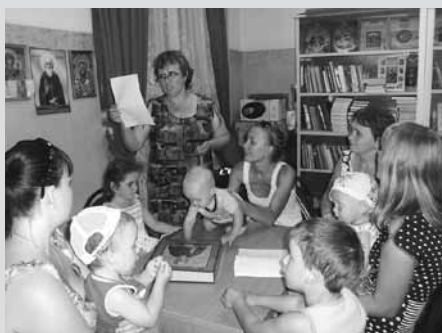
В центре «Благовест» собрались молодые мамы