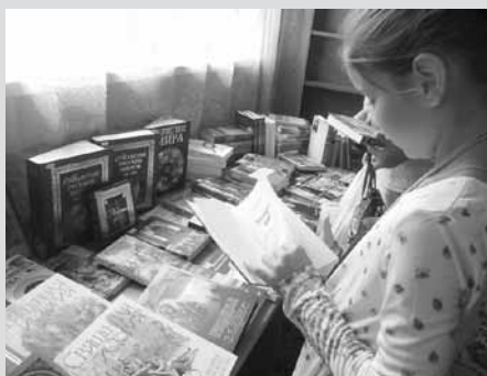
Знакомство с новинками в библиотеке-филиале № 2

Почему мы выбрали такой ход? Две библиотеки уже имеют опыт духовно-просветительской и проектной работы, накоплен фонд православной литературы, налажены связи с благочинием г. Арзамаса. Но реализованные проекты показали, что выполнение задуманного одновременно с обычной работой библиотеки-филиала (обслуживание читателей, плановые мероприятия, работа с фондом) требует огромных затрат сил и времени от всех участников. Поэтому мы решили одновременно и расширить аудиторию проекта, и в то же время сократить нагрузку на