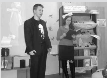
Литературно-музыкальный вечер «Для мира и небес чужой»

Были организованы обучающие занятия для подростков «23 дела с мобильным» , разработанные на основе российской адаптации курса «23 mobilethings». Хотя курс предназначен для библиотекарей, его можно использовать в работе с читателями. Ведь, к примеру, защита своей конфиденциальности, фотосъемка и мобильное видео, совместная работа в сети — подобные вопросы актуальны для всех. Были представлены современные сервисы и мобильные приложения, показаны их возможности для поиска полезной информации, создания православных маршрутов, общения с единомышленниками и т. д. Одновременно мы ненавязчиво гово-