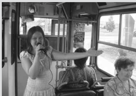
Акция «Маршрутка» с устной экскурсией

надцатый» и в социальных сетях. Насколько востребованным оказался материал, можно судить по откликам: