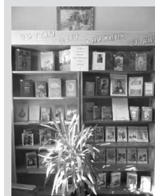
Передвижная выставка из библиотеки Свято-Николаевского монастыря

Создание центра «Благовест» и специализированного фонда православной литературы вызвало большой интерес не только у молодежи, но и у всех жителей микрорайона. Это позволило на базе центра объединиться людям, которым интересны православные ценности. Проводимые здесь мероприятия дали возможность расширить духовно-просветительскую деятельность как библиотеки,