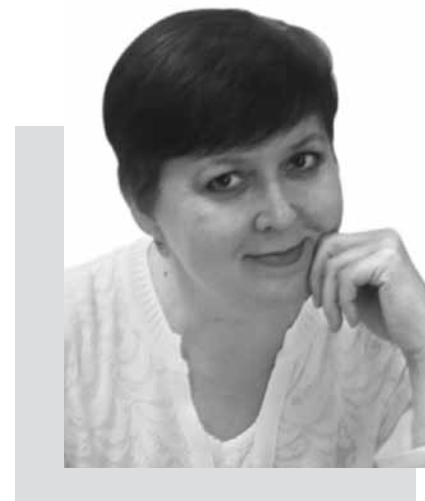
Заведующая методическим отделом Центральной городской библиотеки им. А.М. Горького МУК «Централизованная библиотечная система г. Арзамаса», Нижегородская область