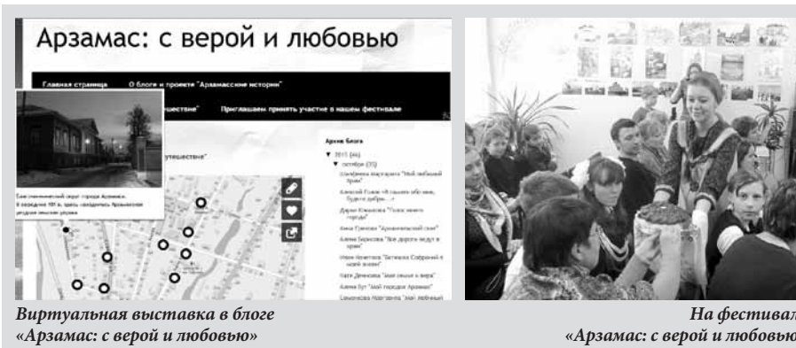
Виртуальная выставка в блоге «Арзамас: с верой и любовью»