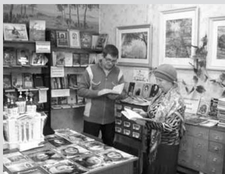
У выставки в библиотеке-филиале № 8

небольшие библиотеки со штатом 3-4 человека. Поэтому к филиалам № 2 и № 8 присоединяется филиал № 5. Главную роль в выборе нового участника сыграло стремление этой библиотеки осваивать и внедрять новое в работу, проявляемый интерес к интернет-технологиям, умение применять обучающие формы работы с детьми, опыт проведения Дней православной книги и других мероприятий близкой тематики. Разработанный проект позволил разделить предстоящую работу на определенные блоки, которые проходили в разных библиотеках. Таким образом, удалось вовлечь в наши мероприятия жителей сразу трех микрорайонов, расположенных в противоположных концах города.