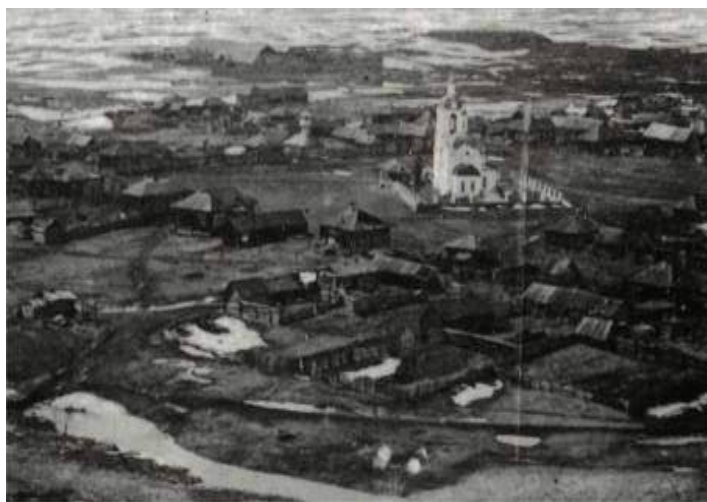
Центр села Устюг. 30-е годы XX века