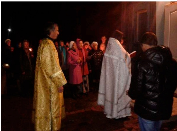
Пасхальный крестный ход

В ночь с 11 на 12 апреля 2015 года произошло историческое событие: первый после многолетнего перерыва Пасхальный крестный ход.