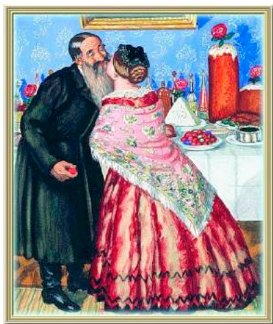
Б.М. Кустодиев. Пасхальный обряд

...Двор затихает, дремлет. Я смотрю через золотистое хрустальное яичко. Горкин мне подарил, в заутреню. Все золотое, все: и люди золотые, и серые сараи золотые, и сад, и крыши, и видная хорошо скворешня, – что принесет на счастье? – и небо золотое, и вся земля. И звон немолчный кажется золотым мне тоже, как все вокруг.