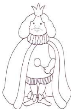
Это мудрый король.

Король, конечно же, об этом не знал и продолжал радоваться жизни. На следующий день после пира с жителями города Чудо произошло что-то странное: все позабыли, что такое любовь, уважение, добро. Повсюду воцарились злость, ненависть и обида.