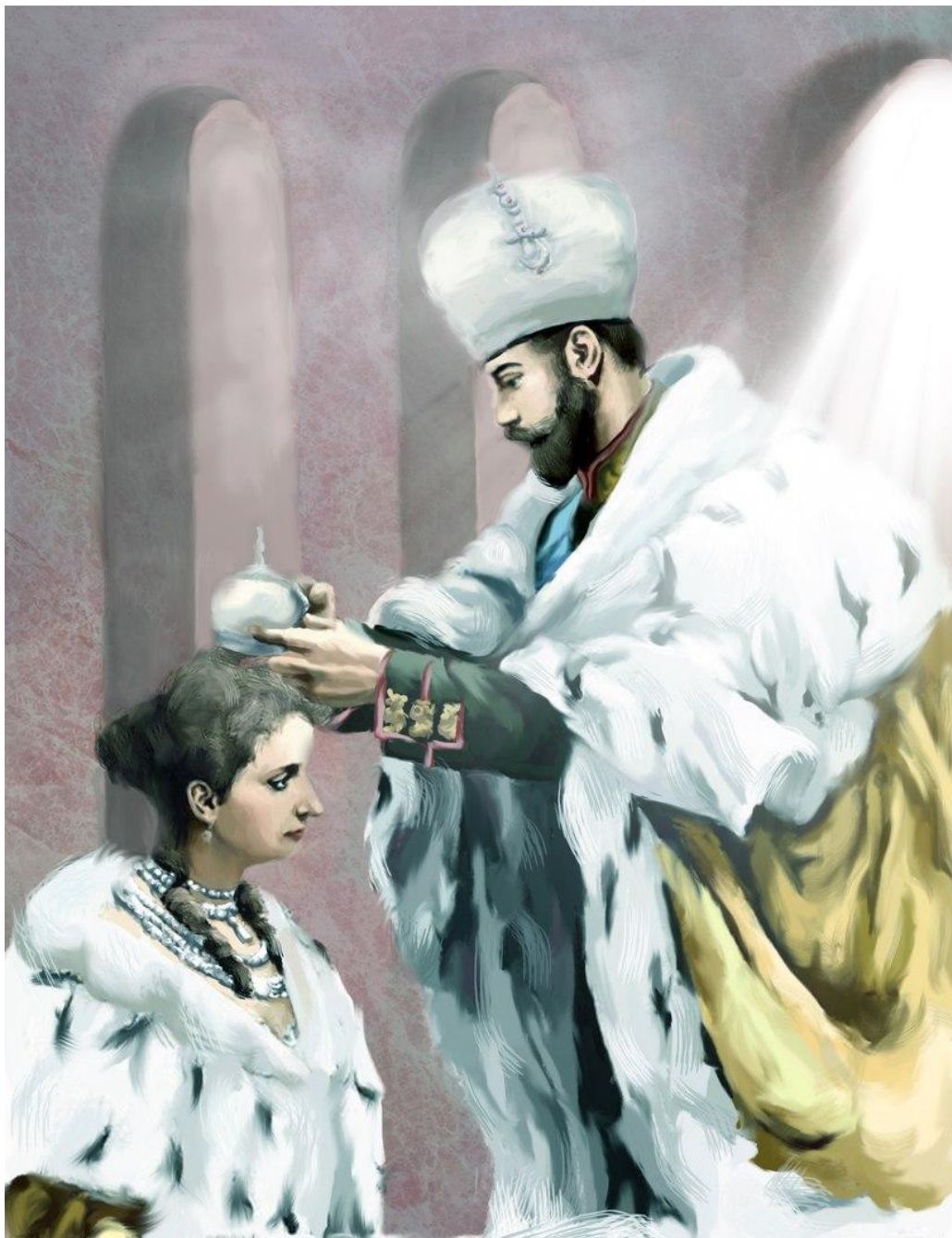
Петрова Светлана Сергеевна «Венчание на царство» компьютерная графика