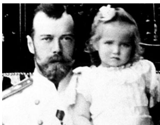
Рисунок 2 – На руках у отца. 1901 год

Из всех сестёр Мария больше всего дружила со своей младшей сестрёнкой Анастасией. Их считали «младшей» парой в противоположность «старшей» – Ольге и Татьяне. Вместе они много проказничали, а чуть позже княжна Мария заинтересовалась игрой в теннис. Любимым увлечением девочек являлась музыка, они запускали свой граммофон и веселились под его мелодии до изнеможения. Великая княжна была талантливой. У неё имелись художественные способности к рисованию, отличными получались наброски, хотя она использовала для этого левую руку, но, к сожалению, к школьным занятиям никакого интереса не было [2].