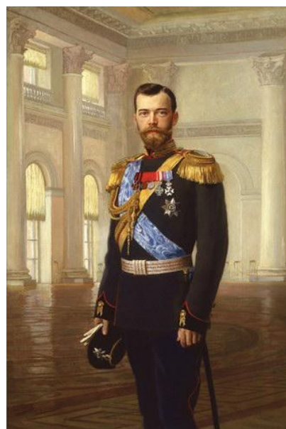
Рисунок 2 - Э.К. Липгарт. Портрет императора Николая II, 1900

Большое количество портретов царской семьи было написано разными мастерами той эпохи, среди которых были такие художники