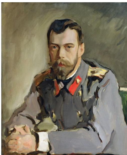
Рисунок 1 - А. В. Серов. Портрет императора Николая II, 1900

Key words: Romanov family, works of art, true values and traditions, music, painting, poetry.