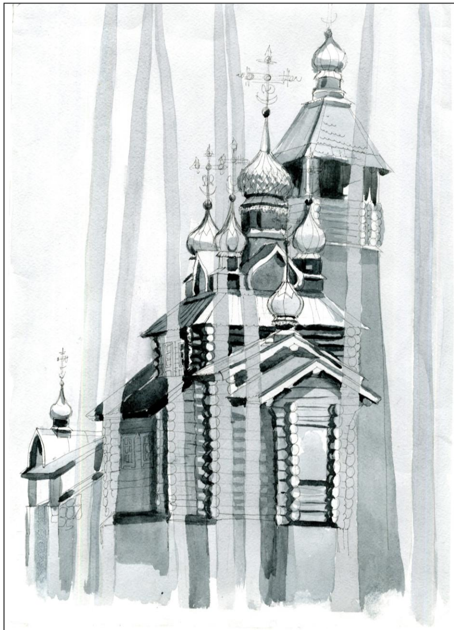
Шигалева Елена Николаевна «Храм Серафима Саровского» бум., кварель