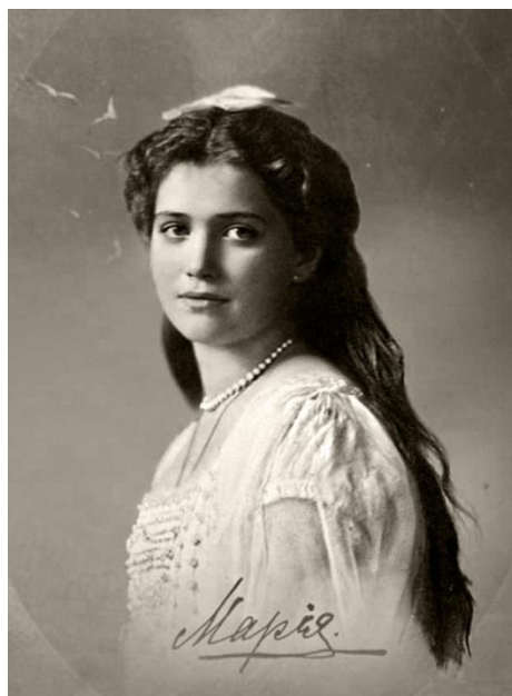
Рисунок 1 – Портрет Великой Княжны Марии Николаевны

М. К. Дитерихс отзывался о Марии очень хорошо. По его словам, Княжна Мария Николаевна была самая красивая, типично русская, добродушная, весёлая, с ровным характером, приветливая девушка. Она умела и любила поговорить с каждым, в особенности с простым человеком. Когда гуляла в парке, рассказывает генерал, Мария иногда заводила разговоры с солдатами по охране, интересовалась и прекрасно запоминала, как зовут их жен и сколько у них детишек. Великая Княжна находила всегда много общих тем для разговоров с ними. А за свою простоту в семье её сестры и